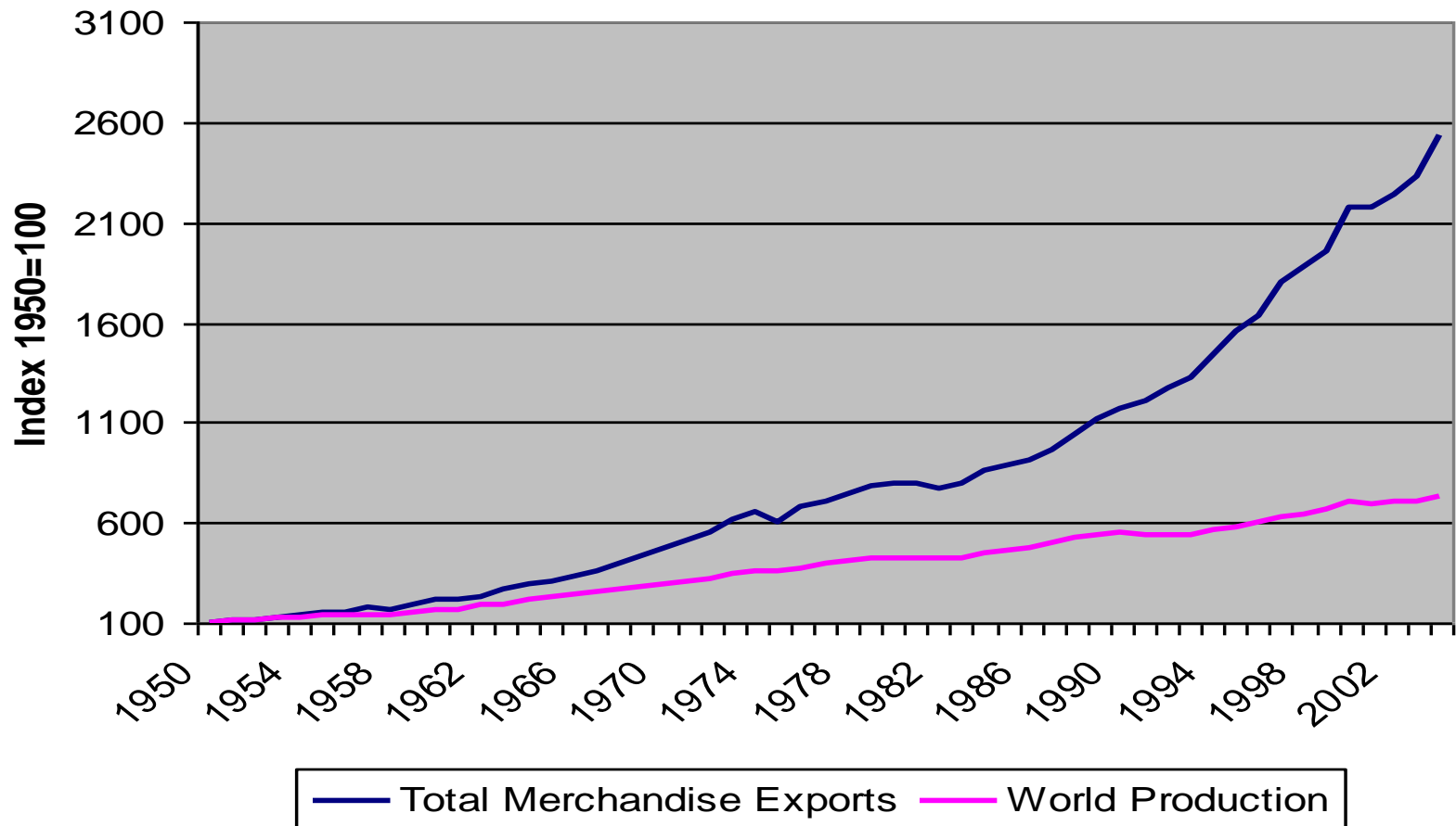
Figure 1.1: Volume of World Trade and World Production, 1950-2004