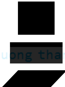
Định nghĩa thấp đến cao