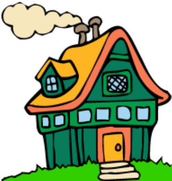
Xây móng đến mái