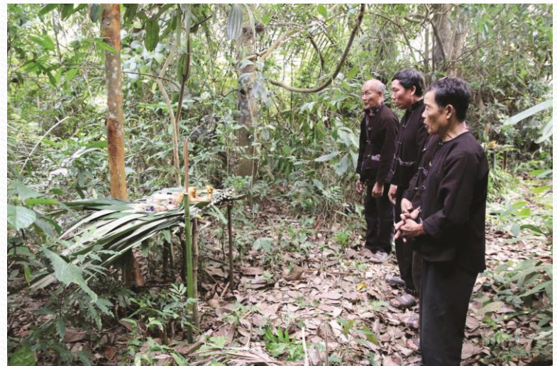
Lễ cúng rừng của đồng bào Lự hàm ý cảm tạ đất trời, thần linh che chở khỏi điều xấu, giúp bản làng mùa màng bội thu, no ấm

http://bvmt.ubdt.gov.vn/rung-duoc-bao-ve-tu-phong-tuc-tap-quan.htm