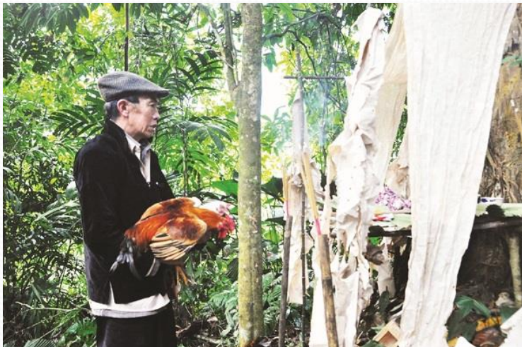
Đồng bào Mông thực hiện nghi lễ cúng thần rừng

https://edu2review.com/news/kien-thuc/su-da-dang-ve-van-hoa-ban-co-biet-5377.html