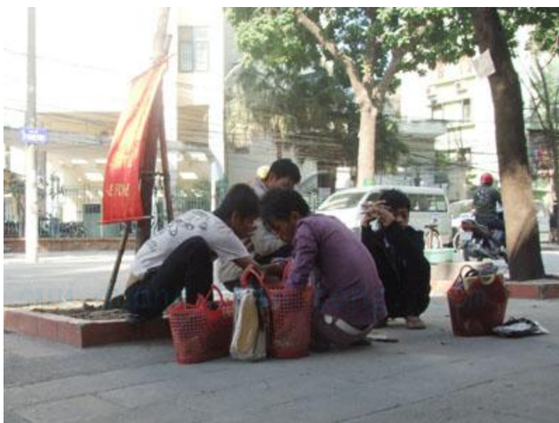
Trẻ em nghèo từ nông thôn lên thành phố kiếm sống