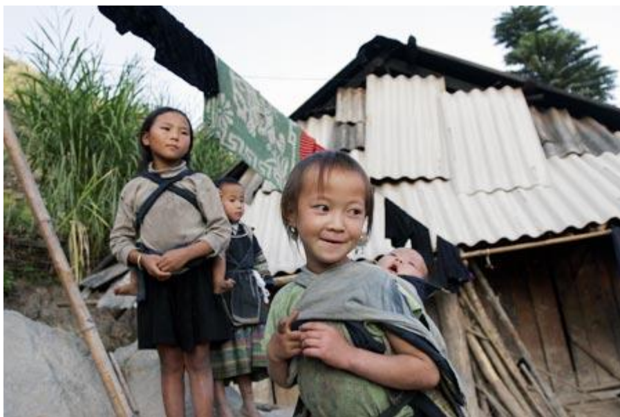
Khoảng 7 triệu trẻ em VN phải sống trong điều kiện thiếu thốn. (Ảnh minh họa)