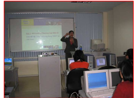
Hình: lớp đào tạo TMĐT cho Vietnam Airlines tại Hà Nội, ngày 4.12.2006