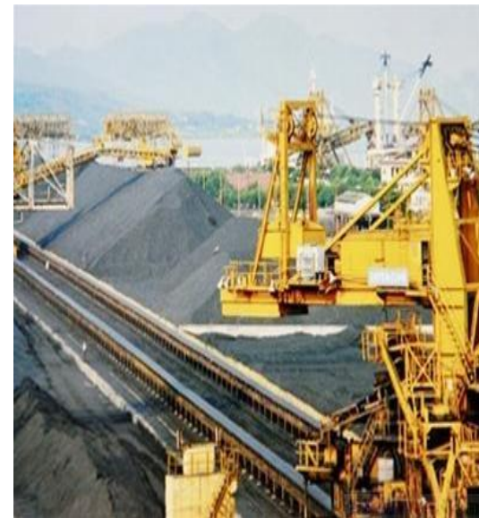
Tài nguyên thiên nhiên