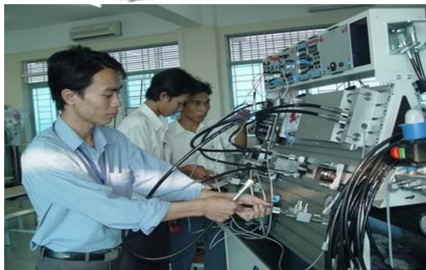
Khoa học công nghệ