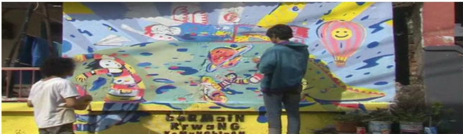
Indonesia ứng dụng công nghệ để quảng bá văn hóa địa phương (Hình minh họa)